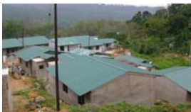
Nouveau village à Poronuwa