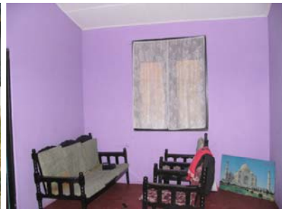
Nouveau village à Henfold