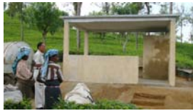
Salle de repos pour les ouvriers