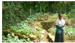
Micro-crédits : élevage et jardinage