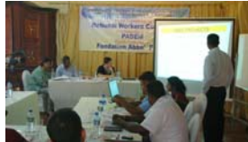
Comité de pilotage avec les managers