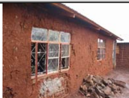
L'école avant l'intervention de PADEM ...